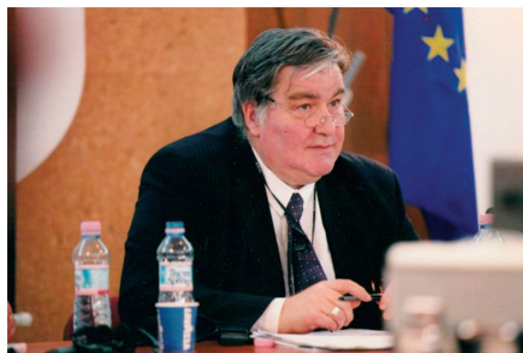
Figura 3. Comissió Europea - DG Mercat Interior, Brussel·les.

ció i l'Agricultura (FAO). Només dir-los que deixava l'Associació ja em van fer membre d'honor i poc temps després, fins allà, a Roma, van venir a passar uns dies de vacances la presidenta i algunes amigues i col·legues. Recordo aquells dies a Roma amb totes aquelles senyores professores d'universitat com una gran celebració, perquè van ser quatre dies de visitar les gelateries i trattories més divertides i riure i fer broma (res a veure amb la bromatologia) sense descans.